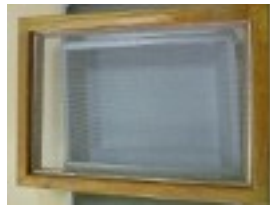
couverte / tamis