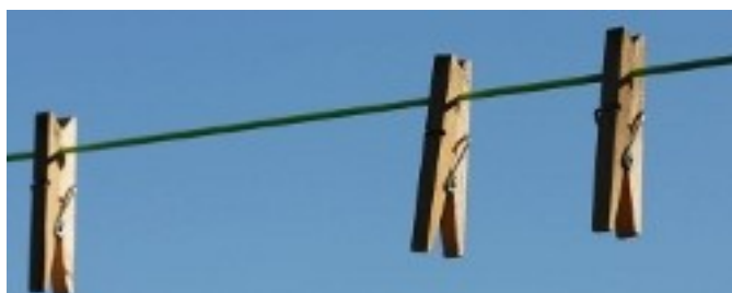
épingles + fil (pour faire sécher)