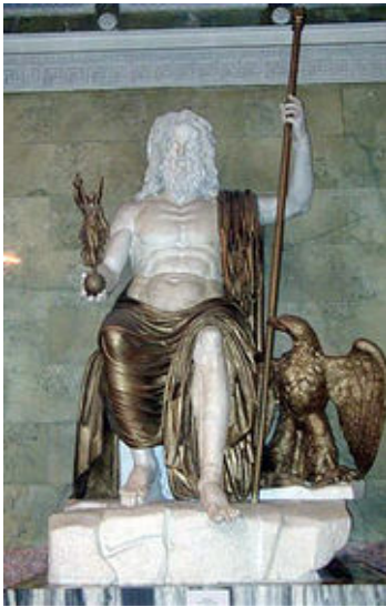
Reconstitution de la statue chrysiléphantine de Zeus olympien.

La statue a été réalisée selon la technique chrysiléphantine : des feuilles d'or et des plaques d'ivoire recouvrant un bâti en charpente de bois. On distingue à droite de Zeus un aigle qui est l'un de ses attributs. Il tient à la main la déesse de la victoire dont le nom est "Niké".