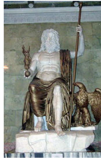
Reconstitution de la statue chrysiléphantine de Zeus olympien.

La statue a été réalisée selon la technique chrysiléphantine : des feuilles d'or et des plaques d'ivoire recouvrant un bâti en charpente de bois. On distingue à droite de Zeus un aigle qui est l'un de ses attributs. Il tient à la main la déesse de la victoire dont le nom est "Niké".