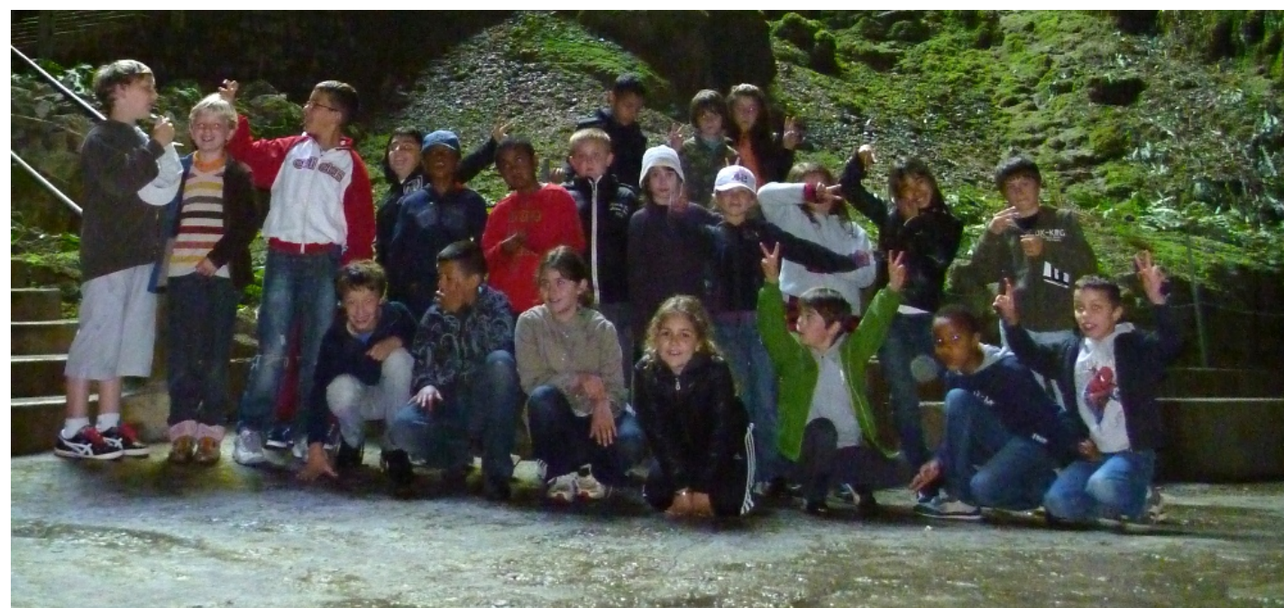
Photo de groupe